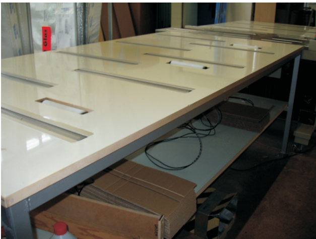
Die Höhenverstellbaren Rollen sind in abgesenkter Position vollständig im Tisch integriert.