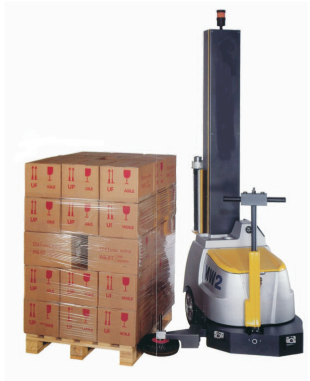
Mobiler Wickelautomat mit Säule geeignet um Ladungen aller Art mit Stretchfolie zu umwickeln.