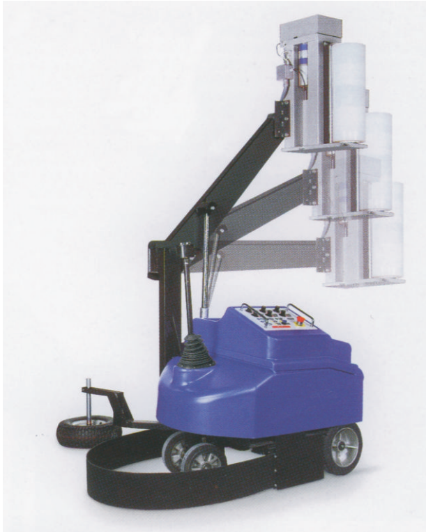
Kompakter, einfach zu bedienender Wickelautomat für Stretchfolie mit höhenverstellbarem Arm ohne Säule für bequemen Durchgang durch tiefe Türen und Räume.