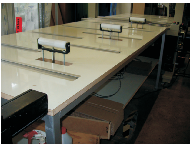
In der obersten Position befinden sich die Rollen 120mm oberhalb des Tisches. Die verschiedenen Positionen können je nach Bedarf individuell eingestellt werden.