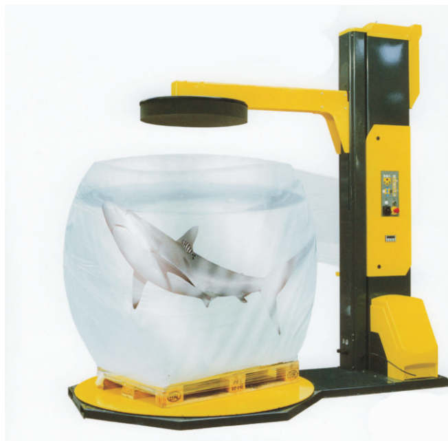
Stationärer Aufwickler mit Drehteller bis zu 1800mm Durchmesser. Optional mit pneumatischer Presseinheit zum stabilisieren der Ladungen.

Aenderungen bezüglich des technischen Fortschrittes vorbehalten!